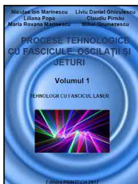
Tratat publicat în 2017

Una dintre caracteristicile sale definitorii a fost enorma capacitate de a acoperi un volum mare de cunoștințe, care au fost din fericire, cuprinse în lucrările publicate și care pentru continuatorii săi reprezintă un sprijin uriaș, astfel în încât, dezvoltarea domeniului de Tehnologie Neconvenționale în Universitate POLITEHNICA din București poate merge mai departe pe alte baze, mai solide. Profesorul a fost extrem de prolific, atingând un nivel incredibil din acest punct de vedere, adevărate recorduri în materie. Iată câteva exemple: 52 de tratate, monografii, manuale, cursuri, îndrumare de laborator etc; 276 de articole publicate; 17 brevete de invenție acordate.