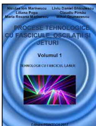
Treatise published in 2017