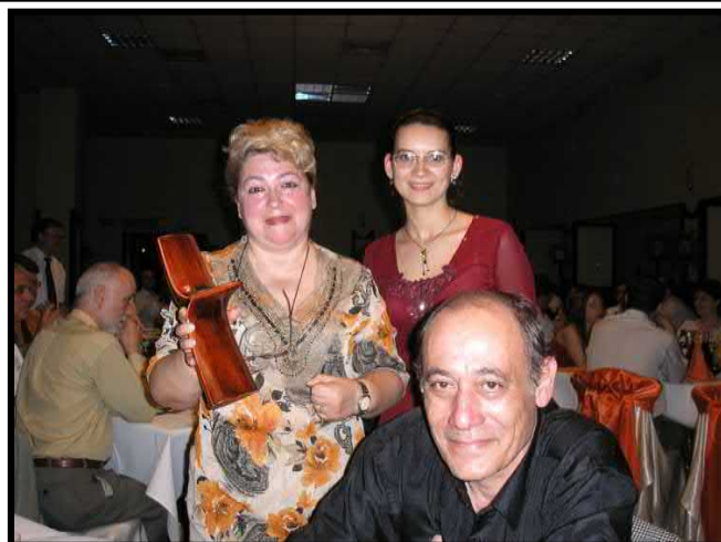
A 13-a ediție a ICNcT, Iași 2007