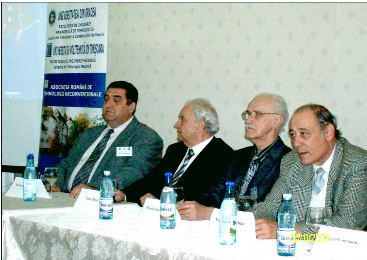
The Four Lords of Nonconventional Technologies at ICNcT 2011, Oradea

Being now at jubilee edition of International Conference of Nonconventional Technologies, ICNcT 20 , from Bucharest, we are looking with hope and responsibility to organizing of editions, 21, 22, 23, 24,... and many more further, such that, the precious heritage left to us by the great personalities of the domain to be taken onward and enriched.