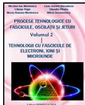
Tratat publicat în 2018