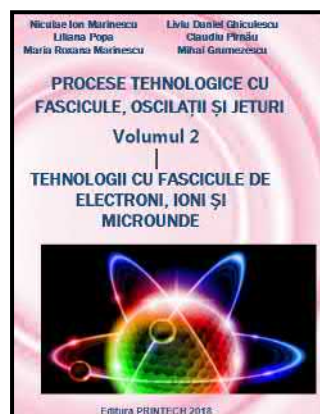
Treatise published in 2018

In the day that he left us, June 20 th 2019, he should take the last variant of the file of the third volume, Technologies with Ultrasonic Waves , for correcting in order to send it to the publishing house. This last mission of our professor was transferred to his collaborators, to complete this volume, argument that Nonconventional Technologies must continue and develop at Polytechnic University of Bucharest.