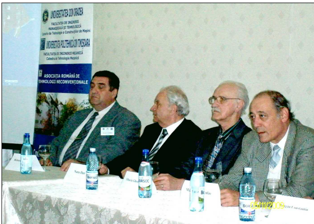
Cei patru lorzi ai Tehnologiilor Neconvenționale la ICNcT 2011, Oradea

Aflându-ne acum la ediția jubiliară a Conferinței Internaționale de Tehnologii Neconvenționale, ICNcT 20 , de la București, privim cu speranță și responsabilitate la organizarea edițiilor, 21, 22, 23, 24,... și multe înainte, astfel încât, prețioasa moștenire lăsată de marile personalități ale Tehnologiilor Neconvenționale să fie dusă mai departe și îmbogățită.