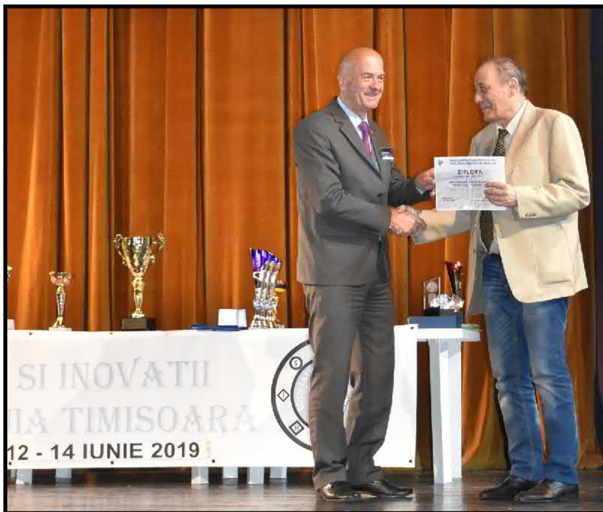
Salonul de invenții Traian Vuia de la Timișoara din 12-14 iunie 2019

Participarea la principalele saloane de invenții naționale de la Cluj-Napoca, Iași și Timișoara a ocazionat prezentarea cu mult succes a rezultatelor cercetărilor sale și la care a obținut peste 70 de medalii și premii din partea organizațiilor de profil. În imaginea următoare, este prezentată, ultima fotografie a regretatului profesor, de la salonul de invenții Traian Vuia de la Timișoara din 12-14 iunie 2019, înainte cu o săptămână de stingerea sa din viață: